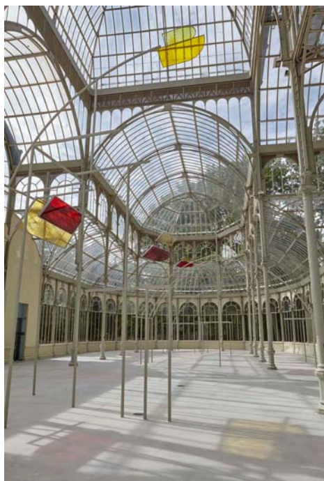
Vista de la exposición Rosa Barba. Registros de tránsito solar , en el Palacio de Cristal. Mayo 2017 Museo Nacional Centro de Arte Reina Sofía

No obstante, un examen más detenido revela que estamos, en realidad, ante un dispositivo cinematográfico. Aunque sus paneles mantienen los trazos y dimensiones de las ventanas, sus colores nos remiten a los filtros propios del cine. Sin embargo, la luz no procede de una lámpara, sino que es natural, desvelando el funcionamiento de la naturaleza en tanto que máquina, y a nosotros como engranajes de la misma.