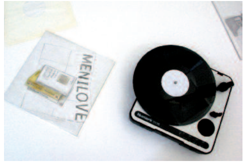
Dora García, Men I Love / The Great Gatsby leído por Andy Kaufman, 2009 (detalle)

Las reflexiones de Mapa Teatro sobre gentrificación; de Joaquim Jordà sobre la reconversión urbanística de Barcelona durante los años noventa; de Hans Haacke en Castillos en el aire (2012), sobre las condiciones sociales, políticas y económicas de un barrio del extrarradio madrileño, o las de Harun Farocki sobre el control y la competencia en el trabajo capitalista, subrayan, de forma explícita o implícita, la existencia de esa otredad negada. Las afueras, las fronteras, todo lo que es expulsado de la norma y el núcleo, constituyen el espacio del no adaptado, la verdadera cara de un sistema que asegura aceptar la alteridad pero cuyos resortes están diseñados precisamente para eliminarla, como pone de manifiesto el vídeo On Translation: Miedo/Jauf (2007) de Antoni Muntadas.