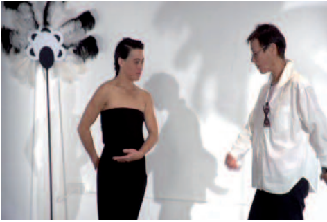
Fotograma de Salomania de Renate Lorenz y Pauline Boudry, 2009